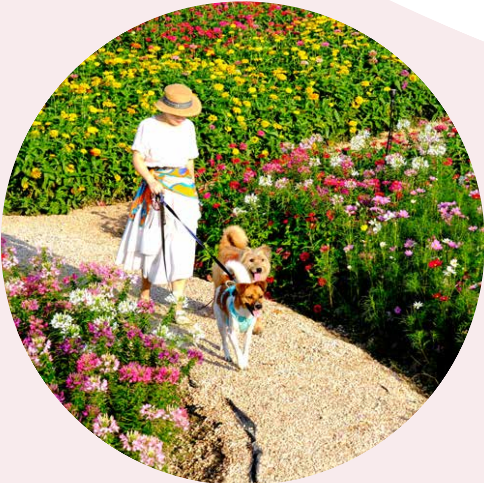
铜鉴湖花海