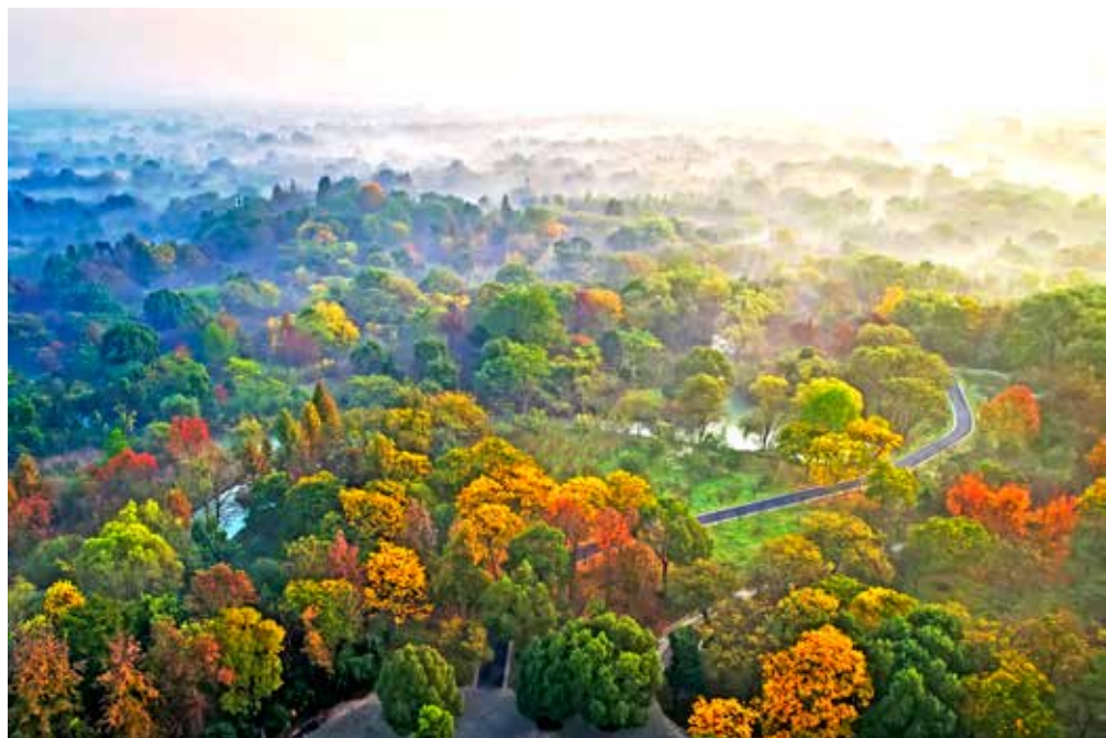
西溪湿地