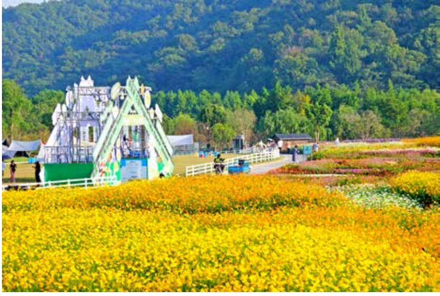
铜鉴湖花海

在铜鉴湖花海，千亩波斯菊与向日葵迎风摇曳，阳光洒落，仿佛大地铺开一幅斑斓油画；步入天目里，艺术与自然在此交融，秋日光影透过清水混凝土建筑，文艺气息扑面而来；白龙潭则是山色空蒙，飞瀑如练，深秋的清冽空气沁人心脾，是都市人难得的“森”呼吸；而西溪湿地则如一首慢板诗，柿影婆娑，把时光也荡得悠长。这个秋天，不妨放慢脚步，来西湖区的山水人文间，打卡属于你的诗意日常。